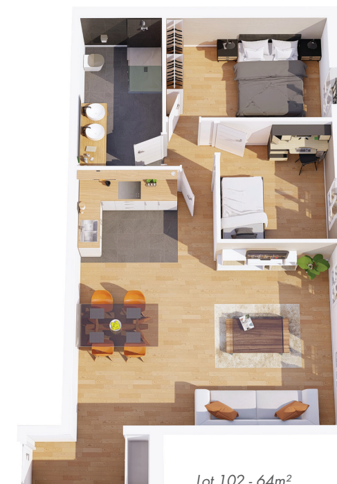
Lot 102 - 64m 2